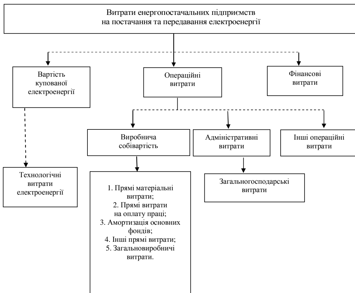
Рис. 2. Склад витрат діяльності електроенергетичних компаній Джерело: [3]

Для прикладу структури витрат операційної діяльності потрібно проаналізувати дані досліджуваних підприємств. З аналізу даних можна зробити висновки, які ж витрати домінують, які можна зменшити задля покращення роботи підприємств та отримання більшого прибутку.