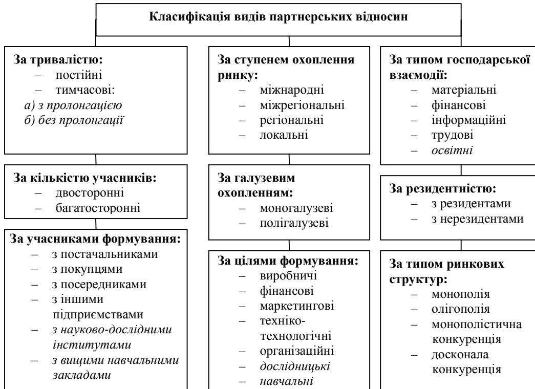
Рис. 1. Розвинута класифікація типів партнерських відносин підприємства * Курсивом зазначено види партнерських відносин, запропоновані автором

На рис. 1 зображено класифікацію партнерських відносин з урахуванням співпраці з ВНЗ.