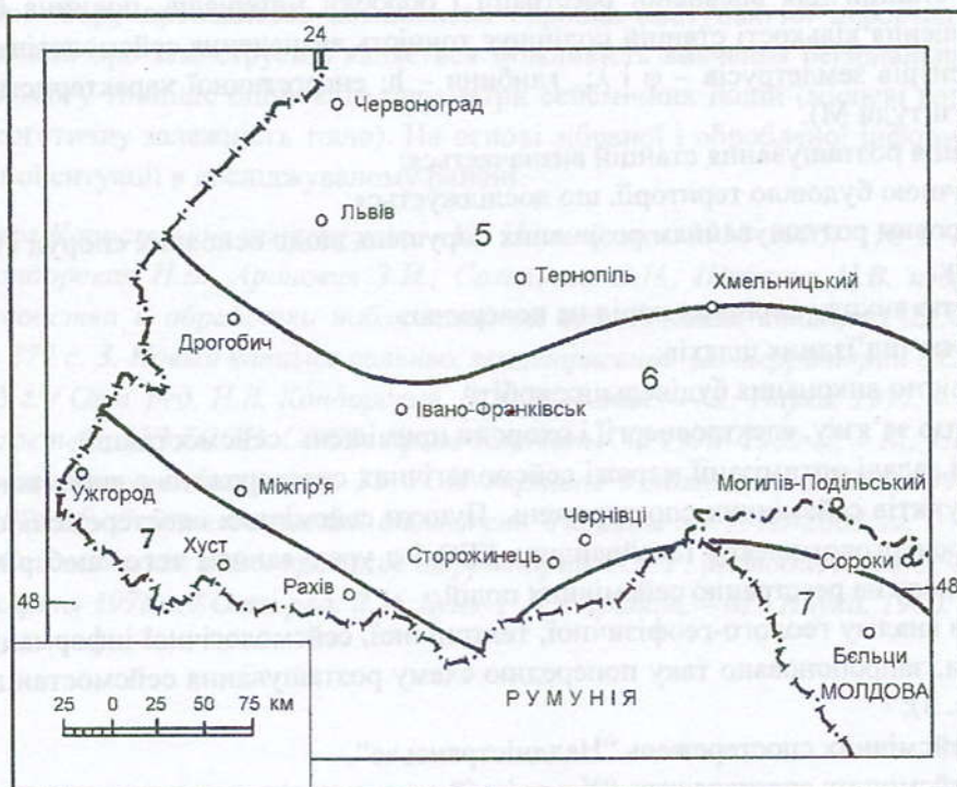
Рис. 2. Карта сейсмічного районування України СР-78 (західні області)

Для вивчення сейсмічного режиму і виявлення закономірностей в змінах геофізичних полів необхідно проводити режимні спостереження протягом тривалого часу (не менше 3–5 років) (Кондорская Н.В. и др., 1981). Проведення сейсмологічних досліджень передбачає розв’язання таких питань: