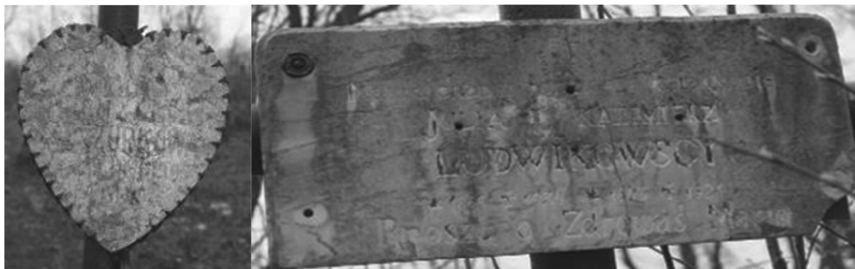
Рис. 4. Пам'ятні дошки з мармуру

Лише на кладовищі на Гуковій горі ми мали можливість спостерігати мармур, при чому і як елемент надгробних пам'ятників, і як пам'ятні дошки, вставлені у металеві оправы та прикріплені до хрестів (рис. 4). Оскільки мармур зазнав значного руйнівного впливу біологічних, температурних та атмосферних чинників, виникає певна проблема з його ідентифікацією.