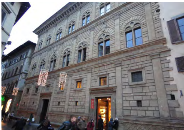
Рис. 1. Імітаційна стилізація Палаццо Руччелай у Флоренції (Л.–Б. Альберті, 1446–1451) Інтерпретація теми ярусного розташування ордерів Колізею на площині фасаду палаццо

Найзначнішим майстром пізнього Відродження був Андреа Палладіо (1508–1580), який поєднав особистий суб’єктивізм із “вічними” цінностями класичної архітектури. А. Палладіо заявив про себе як про великого зодчого робіт, де синтезував уявлення про красу і гармонію, почерпнуту з римської античності, з новою типологією будівель. В основу пластичної розробки лоджії дель Капітаніо у Віченці (1571) лягла тема римської тріумфальної арки, переосмислена у великий ордер: могутні напівколони композитного ордеру об’єднують два поверхи будівлі, капітелі продовжені розкріповками антаблементів (рис. 2).