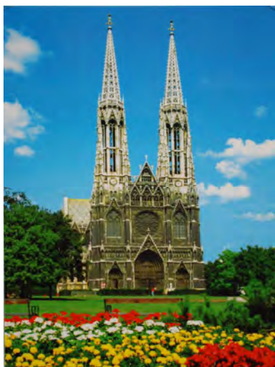
Рис. 5. Аналітична стилізація. Вотивна церква у Відні (Г. Фон Ферстель, 1856–1879) Зразок прагнення до точності у відтворенні прикладів французької готики XIV ст.

Прагнення до точного відтворення архітектурних деталей та мотивів на фасадах будівель не виключало і “творчий елемент” з архітектурної практики, який міг полягати у зміні значення деталей у цілісній композиції, у комбінуванні форм з різних прототипів, проте завжди із збереженням вірності прототипу. Слід наголосити і на тому, що, на відміну від романтичної стилізації, де еклектичне поєднання форм із різних джерел відбувалося інтуїтивно та емоційно, аналітична стилізація передбачала “наукове” обґрунтування можливості такої комбінації. Згадати можна “російсько-візантійський стиль” К. Тона (рис. 6) або “стиль Другої імперії”, який виник у Франції часів Наполеона III. Треба зауважити, що практика аналітичної стилізації часто входила у суперечності із реальними потребами та новими конструктивними можливостями. Прикладом чого є ратуша у Філадельфії, зведена у “стилі Другої імперії” у 1897–1901 рр. за проектом шотландського архітектора Дж. Мак Артура (рис. 7). Монументальні форми “стилю” суперечили просторовій структурі будівлі та використаним технологіям, у результаті чого точно цитовані ренесансно-барокові форми були спотворені невластивими пропорціями.