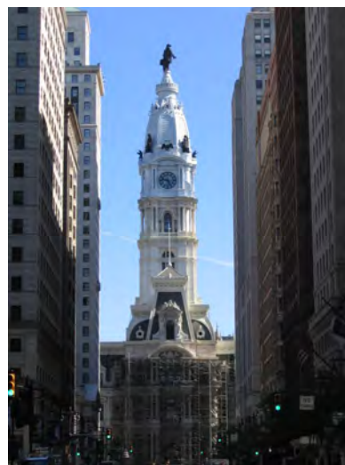
Рис. 7. Аналітична стилізація. Ратуша у Філадельфії, США (Дж. Мак Артур, 1897–1901) Проблематичність реалізації принципів аналітичної стилізації у специфічних типах громадських будівель, що викликає спотворення масштабів та пропорцій

Отже, метод аналітичної стилізації спирався на принцип наукового та раціонального осмислення архітектурного минулого, де акту творчості завжди передував акт пізнання та