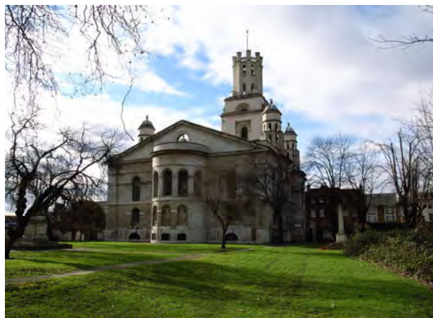
Рис. 3. Романтична стилізація. Церква Св. Георгія у Лондоні (Н. Ховксмур, 1714–1729) Еклектичне поєднання готичних елементів із романськими та ренесансними

Готиці у період романтизму належить, безумовно, провідна роль. Проте романтизувалися архітектурні варіації на теми інших древніх культур, наприклад, Стародавнього Єгипту. Єгипетські мотиви не були пов’язані в європейській архітектурі з якимись конкретними історичними періодами та подіями, тому їх інтерпретація відбувалася, як правило, на основі поєднання з класицистичними композиційними схемами. Таким прикладом є Царські ворота поблизу Петербурга, споруджені у 1827–1830 рр. за проектом А. Менеласа (рис. 4). Ворота являють собою пропілеї – в’їзд у Царське Село зі сторони Петербурга. Масивним пілонам, що обрамляють вхід, надано єгипетських рис. У пілонах розташовані кам’яні караульні, завершуються вони чавунними карнизами, які прикрашені зображеннями сонячних дисків та зміїних голів. Із зовнішньої сторони ворота облицьовані чавунними плитами із тридцятьма зображенням різних сцен з єгипетської міфології. Єгипетські мотиви потрактовано вільно та суб’єктивно, оскільки важливою була не архітектурна “правдивість”, а настрої, стан таємничості та романтичності.