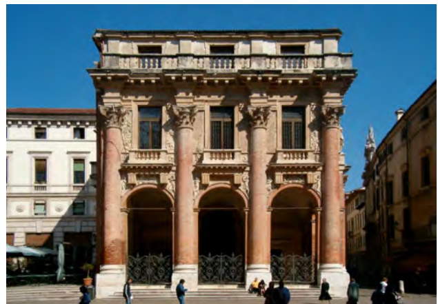
Рис. 2. Імітаційна стилізація Лоджія дель Капітаніо у Віченці (А. Палладіо, 1571) Нове тлумачення теми римської тріумфальної арки

Зважаючи на практику “imitatio” – імітації, яка стала ідеологічною основою практики стилізації доби Ренесансу, такий тип стилізації названий імітаційною . Її особливість полягає в специфіці інтерпретації прототипу, де він змінюється, проте залишається впізнаваним, виражаючи індивідуальність творчого задуму. Імітаційна стилізація втілює одночасно захоплене та прагматичне ставлення до минулого, де минуле постає взірцем, гідним для інтерпретації та “матеріалом” для вдосконалення.