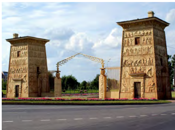
Рис. 4. Романтична стилізація. Єгипетські ворота у Царському Селі біля Петербурга (А. Менелас, 1827–1830) Романтична вільна варіація на тему древньої культури

Романтична стилізація в архітектурі кінця XVIII – першої половини XIX ст. стала втіленням емоційного та асоціативного відношення до минулого, яке мало надзвичайно важливе значення для теперішнього та майбутнього, проте важливою була не точність цитування, а суб’єктивне і настроєве переживання минулого.