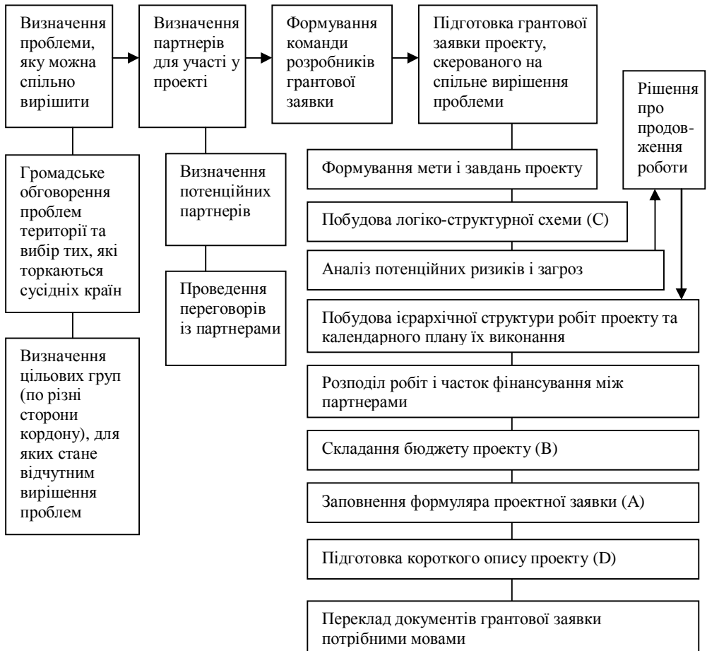
Рис. 2. Ієрархічна структура робіт із підготовки заявки на участь у конкурсі проектів Програми Добросусідства “Польща – Білорусь – Україна 2007 – 2013”

Отже, підготовка заявки для участі у конкурсі проектів Програми може відобразитися ієрархічною структурою робіт, наведеною на рис. 2.