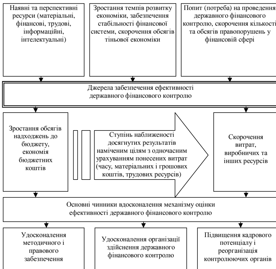
Рис. 2. Джерела забезпечення і основні чинники вдосконалення механізму ефективності державного фінансового контролю

На нашу думку, основними джерелами забезпечення ефективності державного фінансового контролю є: 1) зростання обсягів надходжень до бюджету, економія бюджетних коштів внаслідок здійснення державного фінансового контролю; 2) скорочення витрат, виробничих та інших ресурсів на проведення державного фінансового контролю (рис. 2). Виходячи з такого підходу, метою оцінки ефективності державного фінансового контролю повинно стати визначення ступеня наблизеності досягнутих результатів наміченим цілям із одночасним урахуванням понесених витрат (часу, матеріальних і грошових коштів, трудових ресурсів).