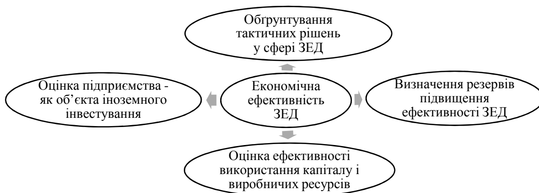
Рис. 3. Сфери використання запропонованих показників розрахунку ефективності ЗЕД

Результатом оцінювання ЗЕД повинно стати виявлення резервів зростання ефективності експорту. Резерви – це наявний потенціал підвищення ефективності та результативності ЗЕД підприємства. З одного боку, вони пов’язані зі зниженням витрат виробництва, а з іншого – зі збільшенням обсягів збуту на іноземних ринках.