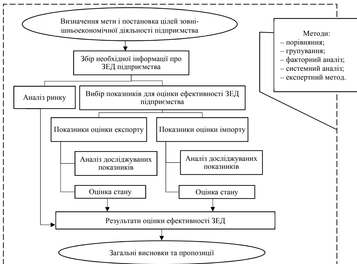
Рис. 2. Методика оцінювання ЗЕД ПрАТ “Могилів-Подільський консервний завод”

Насамперед варто проаналізувати виконання зобов'язань підприємства за контрактами з іноземними партнерами. Для цього потрібно вивчити кількість і вартість укладених угод, виконаних торгових угод та протермінованих контрактів. Для оцінювання рівня і якості виконання зобов'язань за контрактами з іноземними контрагентами пропонуємо розраховувати узагальнювальний коефіцієнт протермінованих зобов'язань за формулою: