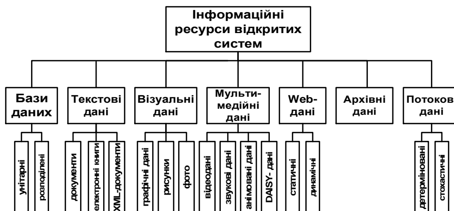
Рис 1. Класифікація інформаційних ресурсів відкритих систем за способами подання

Загальну схему класифікації інформаційних ресурсів відкритих систем за способами їх подання показано на рис. 1.