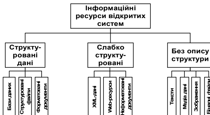
Рис. 2. Класифікація інформаційних ресурсів відкритих систем за структурою

Загальну схему класифікації інформаційних ресурсів відкритих систем за способами їхнього структурування показано на рис 2.