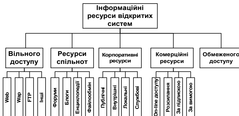
Рис. 3. Класифікація інформаційних ресурсів відкритих систем за способами доступу

Класифікація інформаційних ресурсів відкритих систем за способами доступу. Способи доступу до інформаційного ресурсу відкритих систем визначають набір принципів, засобів, технологій, правил і порядку взаємодії користувачів з відкритими системами, метою якої є отримання результатів їх функціонування [8].